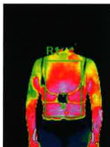
水素風呂Lita Life 15分入浴後