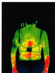
普通入浴 湯上がり5分後