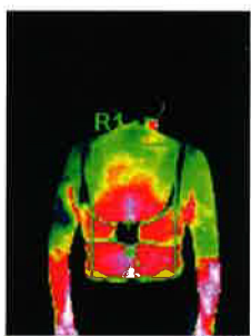
水素風呂Lita Life 湯上がり5分後